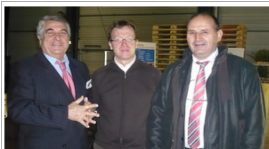
Les présidents du SYPAL et du SIEL entourant l'organisateur ATLANBOIS affichent une satisfaction légitime.

Le « grand public », quant à lui, découvre avec surprise que l'industrie de la palette et de l'emballage représente un débouché pour près d'un