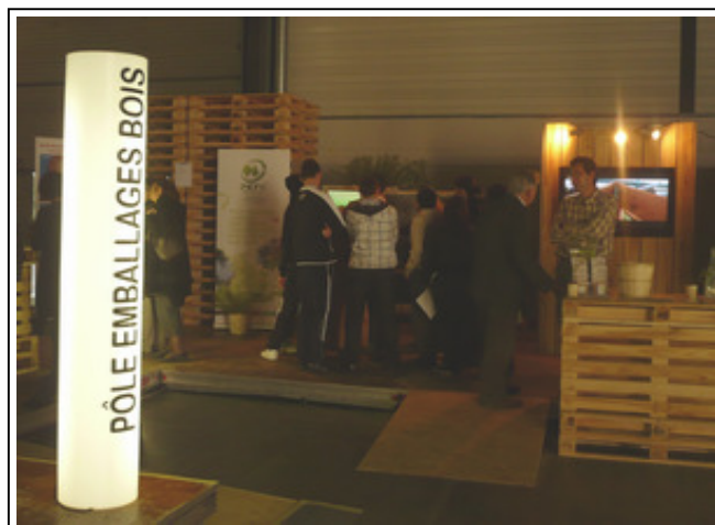
Affluence record au stand du pôle emballages bois.

Car il ne s'agit pas d'une simple présence statique, mais bien d'une animation centrée autour des emballages bois. Le « jeu » consiste à faire remplir aux visiteurs un questionnaire pour évaluer leur connaissance des emballages bois et de la problématique de la filière bois en général.