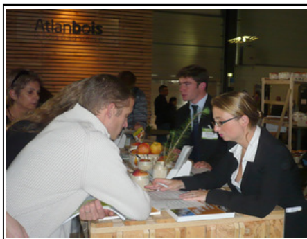
Les visiteurs, après avoir rempli le questionnaire écoutent avec intérêt les explications de l'experte du FCBA.

répondre aux questions souvent très pertinentes de visiteurs intéressés par le bois sous toutes ses formes.