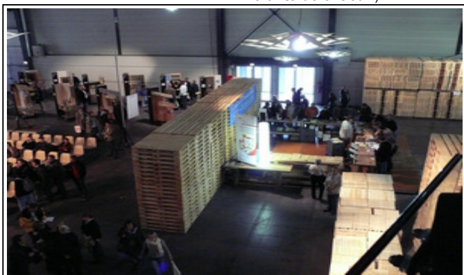
Un décor futuriste qui fait la part belle aux palettes et emballages bois.

poser gratuitement d'un espace dédié à ses différents produits : caisses, palettes et cagettes.