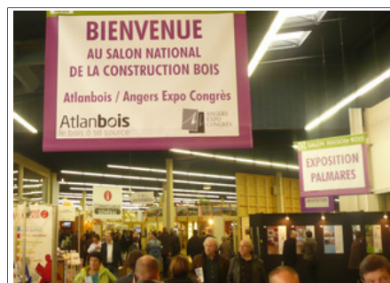
La foule était au rendez-vous

le « Bois international » tenait un stand et l'on a pu apercevoir, dans les allées les journalistes de son confrère « Bois Mag » qui couvraient l'évènement.