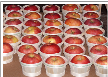
Emballage bois écolo pour des fruits bio.

C'est ici qu'interviennent les représentants du FCBA. Ils ont, eux aussi répondu présent à l'appel. Leur compétence est très utile pour