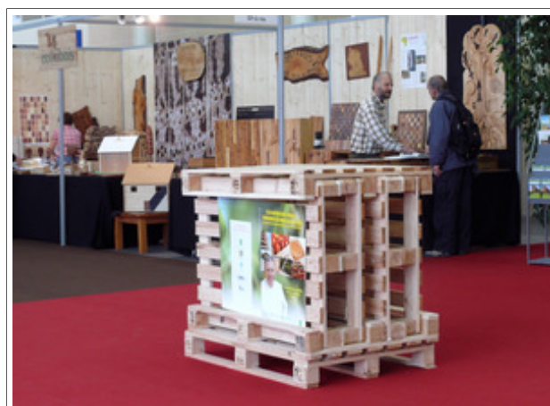
Dès l'entrée du salon, la palette accueille le visiteur.

Il ne restait plus alors qu'à organiser les modalités des livraisons et des récupérations après le salon (opération complexe réalisée grâce à la bonne volonté de chacun).